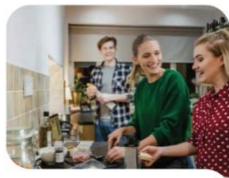
Reto 1. EMANCIPACIÓN

Anticipar los procesos de emancipación de la juventud.