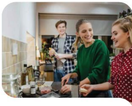
Reto 1. EMANCIPACIÓN