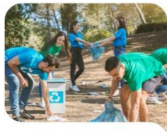
Reto 2. CONSTRUCCIÓN SOCIAL

Convertir a la juventud en catalizadora del proceso de transformación y construcción social.