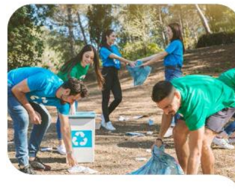
Reto 2. CONSTRUCCIÓN SOCIAL