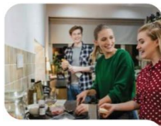
Reto 1. EMANCIPACIÓN

Anticipar los procesos de emancipación de la juventud.