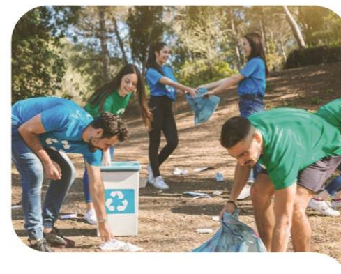
2. Erronka GIZARTE- ERAIKUNTZA