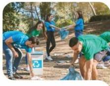
2. Erronka GIZARTE- ERAIKUNTZA

Gazteak gizartea eraldatzeko eta eraikitzeko prozesuaren katalizatzaile bihurtzea.