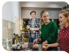
1. Erronka EMANTZIPAZIOA