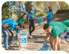
2. Erronka GIZARTE- ERAIKUNTZA

Gazteak gizartea eraldatzeko eta eraikitzeko prozesuaren katalizatzaile bihurtzea.