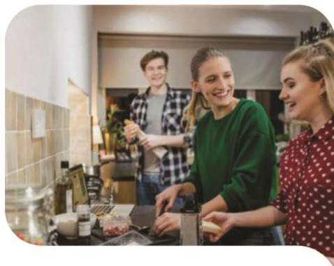
1. Erronka EMANTZIPAZIOA